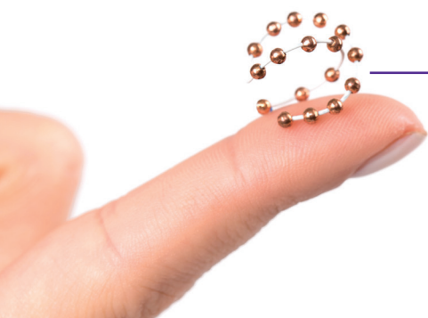
— Ballerine ware grootte (Ø15 mm)

Het spiraaltje is geschikt voor vrouwen tussen 16 en 45 jaar. De Ballerine is door de zeer dunne inbrenghuls makkelijk te plaatsen en daardoor ook geschikt voor jonge vrouwen die nog niet eerder bevallen zijn. Door de unieke en soepele 3D-vorm kan de Ballerine een mooi alternatief zijn voor vrouwen die minder goed reageren op andere koperspiralen.